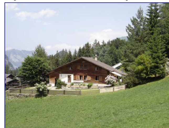
Haus-Einrichtungen im Parterre

Das Clubhaus Allmiried ist in der wunderschönen Alpenwelt des Diemtigtals angesiedelt. Mitten im der Wander- und Bike Arena des Wiriehorn. Es eignet es sich besonders für Gruppen und Familienferien. Im Sommer bieten sich unzählige Bikerouten und Wandermöglichkeiten im ganzen Tal an. Ob Lamatrekking, Tennis oder Bike - Downhill - all dies wird in nächster Nähe angeboten. Ihren Aktivferien sind keine Grenzen gesetzt.