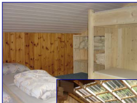
Zimmer mit Einzel und Kajütbetten