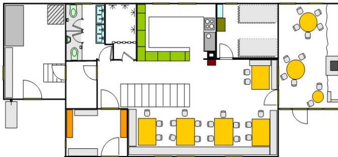
Haus-Einrichtungen im 1. Stock

der Grillraum, die Terrasse und die Spielwiese erreicht man durch eine Türe vom Aufenthaltsraum. Gartentische und Gartenstühle sind vorhanden.